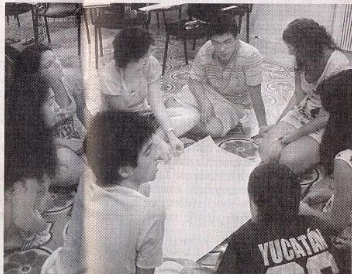
Τα μαθήματα του ΚΕΔΕ στις Σπέτσες έδωσαν στα παιδιά την ευκαιρία να διαπιστώσουν ότι η Ιστορία έχει πολλές όψεις.